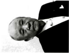
全国中華料理生活衛生同業組合連合会