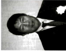
愛知県中華料理生活衛生同業組合

愛知県理事長は就任1年目で新進気鋭の期待の理事長です。全国から多数の組合員さんの参加を頂き、大いに激励頂けますようお願い申し上げます。私も皆様にお会い出来ることを楽しみにしております。