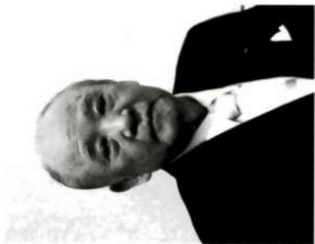
全国中華料理生活衛生同業組合連合会