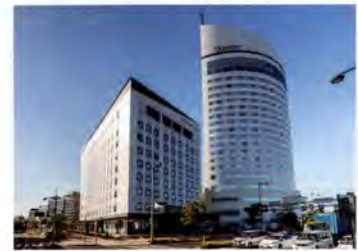
JRクレメントイン高松(左) JRホテルクレメント高松(右)

1968年東京都生まれ。'88年に「赤坂四川飯店」に入社。陳健一氏の下で修業を積む。2001年より「szechwan restaurant 陳」の料理長を務め、'04年11月第5回中国料理世界大会にて日本人初の金賞受賞。'08年には四川飯店グループを統括する取締役総料理長に就任。独立後'17年に火鍋店「ファイヤーホール4000」を開き、'18年には麻布十番店もオープン。同12月に南青山7丁目に「4000 Chinese Restaurant」開店。他、専門学校や料理教室の講師、イベントや料理番組等に出演し、多方面で活躍中。