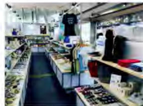
高松港公式ショップ 海の市場

JRホテルクレメント高松(7:30集合)→高松港(8:12発)→直島 宮浦港(9:02着)→赤かぼちゃ・直島銭湯「I♡湯」・直島バヴィリオン(9:15~9:45)→地中美術館、ヴァレーギャラリー、ベネッセハウス ミュージアム(10:00~12:50)→ミュージアムレストラン 日本料理 一扇[昼食](13:00~13:45)→直島 宮浦港(14:20発)→高松港(15:20着)→高松港公式ショップ 海の市場[お買い物](15:30~15:50)→高松空港(16:30着)