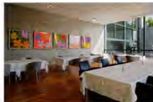
ベネッセハウスミュージアムレストラン