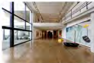
ベネッセハウスミュージアム